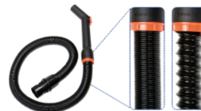
. Tubo estensibile 1/6 mt . Extensible pipe from 1 to 6 mt