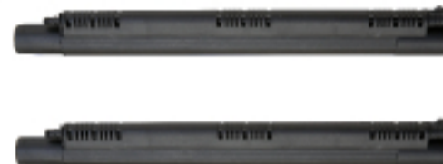
. Prolunghe . Extensions