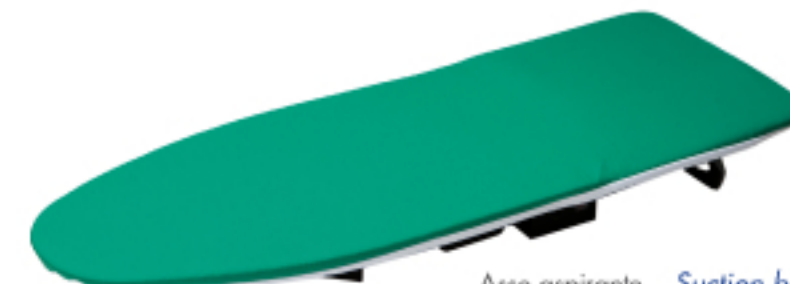
. Asse aspirante . Suction board