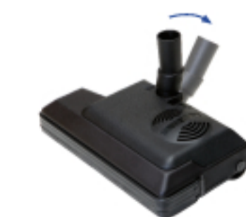
. Battilappeto . Carpet sweeper