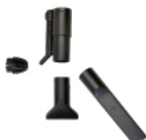
. Portabocchettina . Support for hub