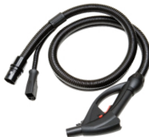
. Impugnatura con flessibile . Grip with flexible piece