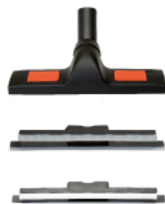
. Spazzola multifunzioni . Multi-functions brush