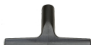
. Tergivetro mm 250 . Wiper mm 250