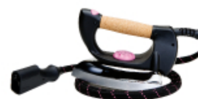
. Ferro da stiro . Iron